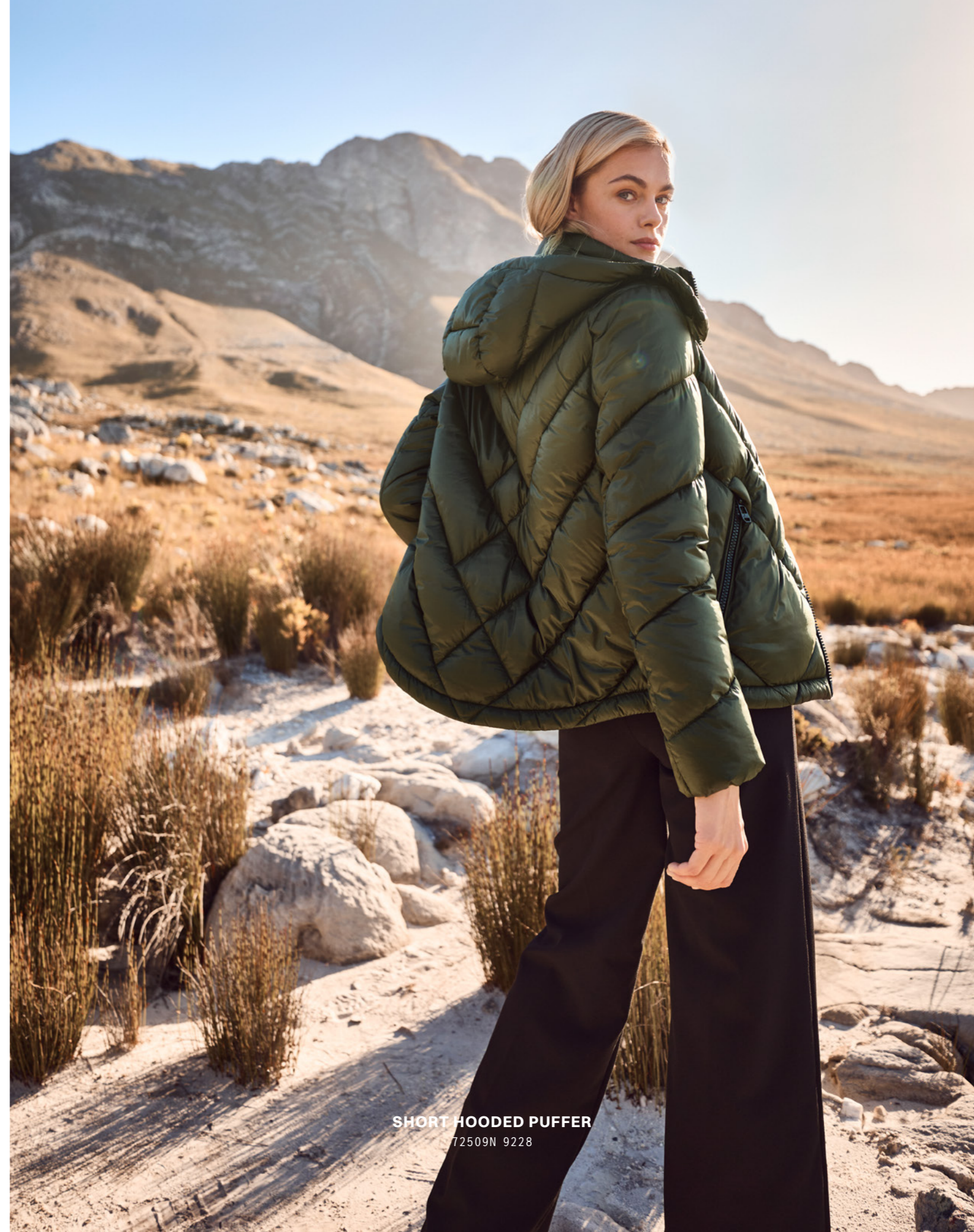
SHORT HOODED PUFFER 72509N 9228