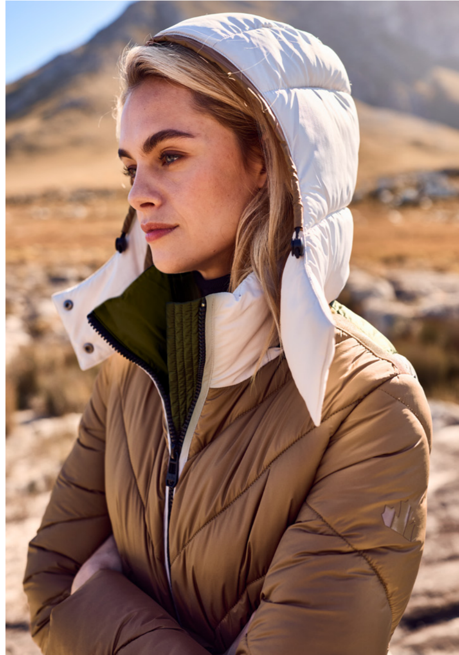
QUILTED COLOURBLOCKING PARKA 82548N 9228