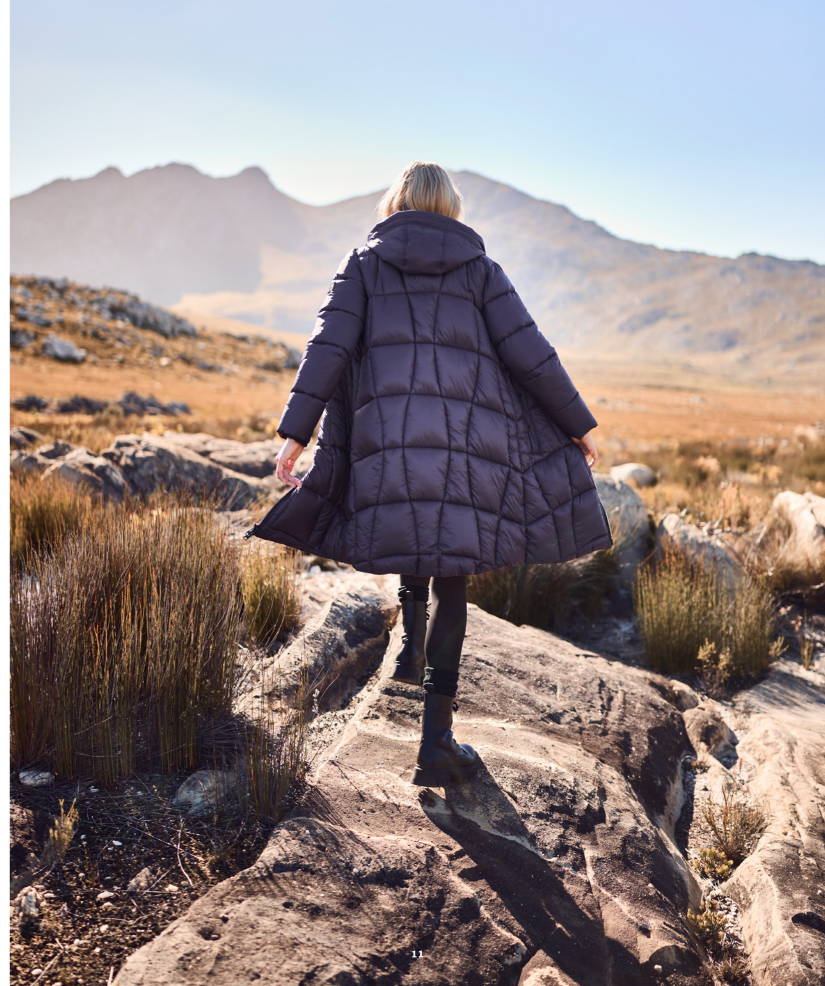
LONG WAVE QUILTED PARKA 82541N 9228