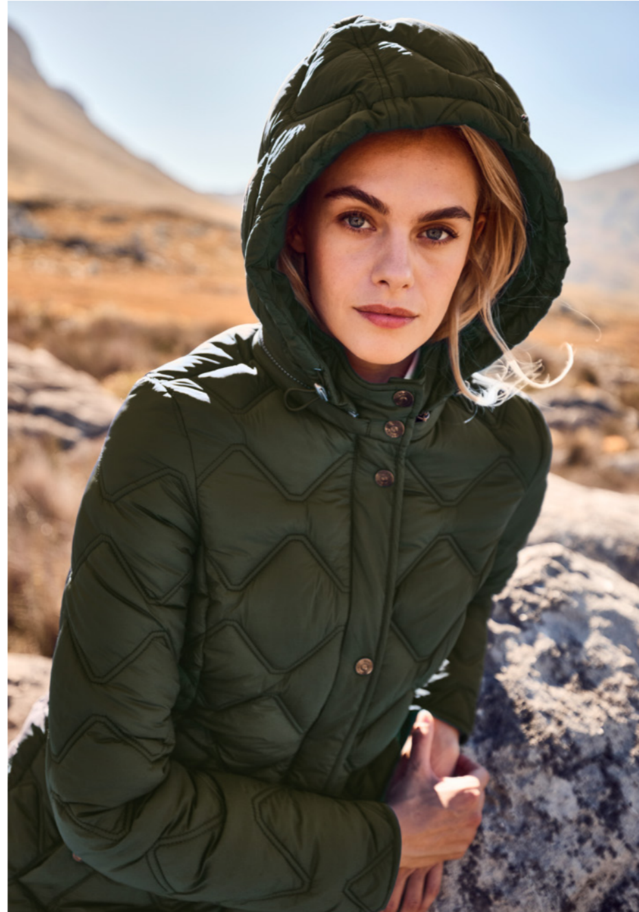
LIGHTWEIGHT QUILTED LONG JACKET 82542N 9228