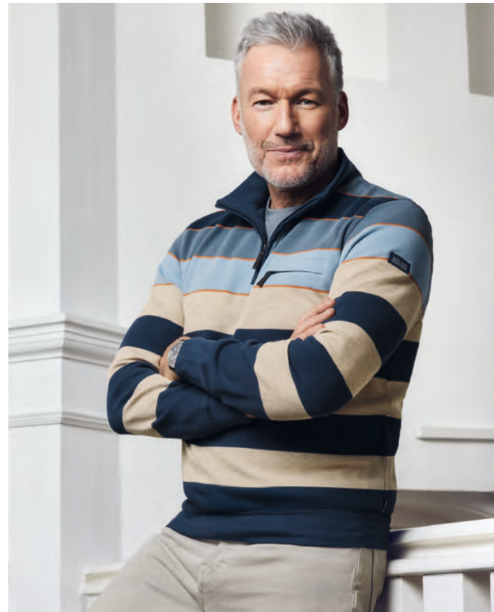
SWEATSHIRT STAY FRESH® 27831

„Ein gutes Sweatshirt ist wie dein Lieblingslied: Du kommst immer wieder darauf zurück, weil es einfach passt.“