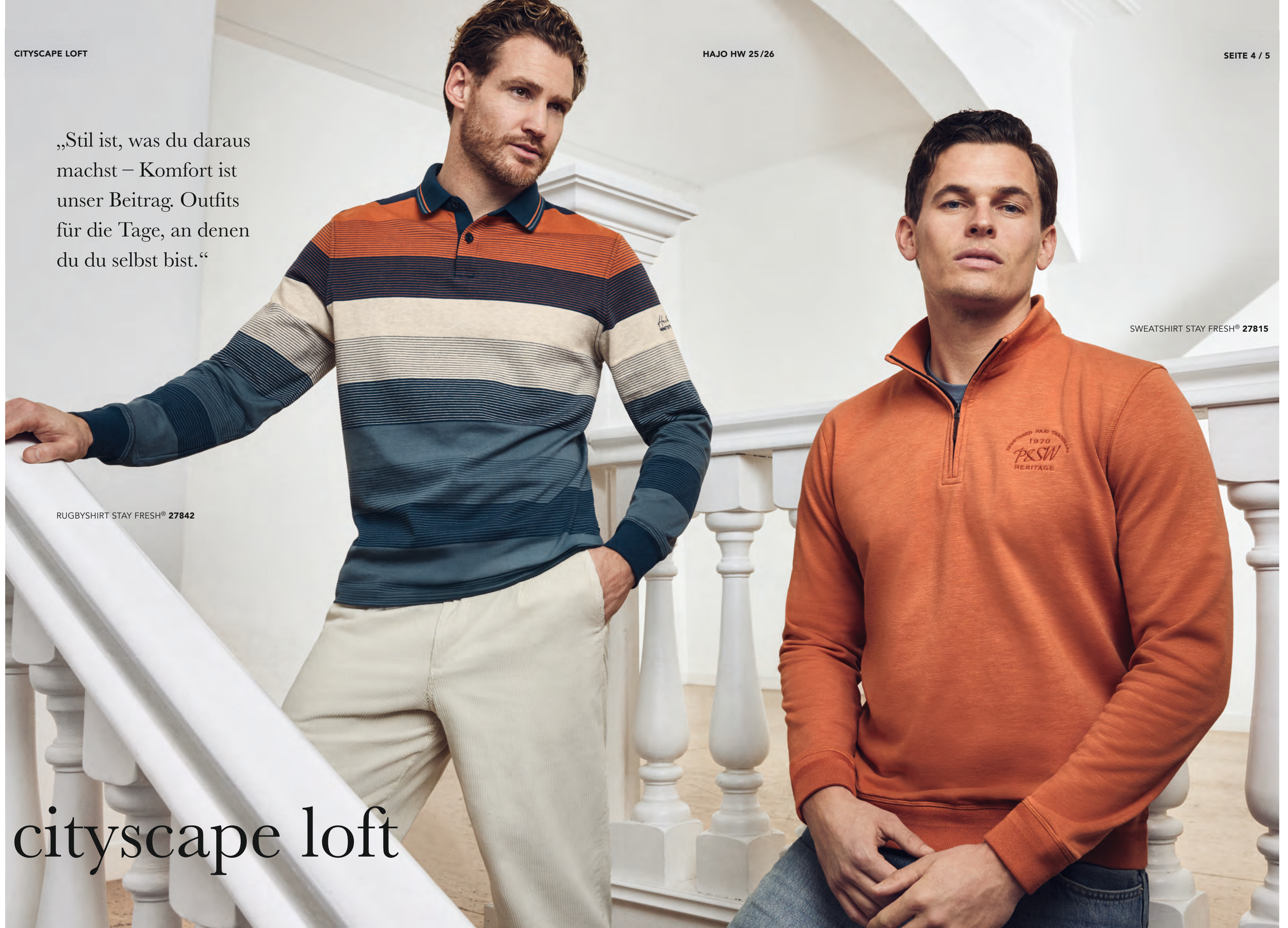
SWEATSHIRT STAY FRESH® 27815

„Stil ist, was du daraus machst – Komfort ist unser Beitrag. Outfits für die Tage, an denen du du selbst bist.“