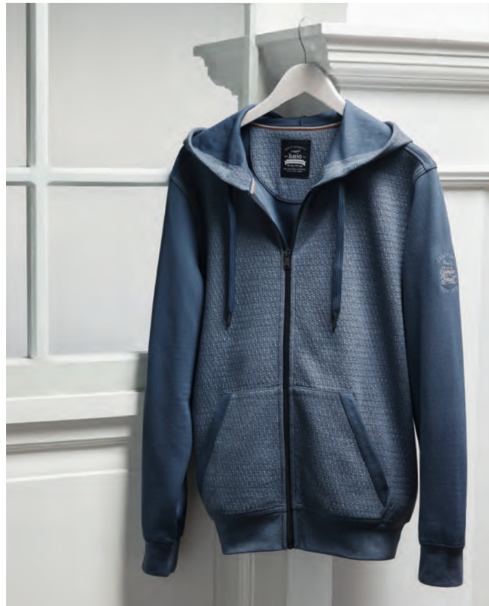
SWEATJACKE MIT KAPUZE STAY FRESH® 27811